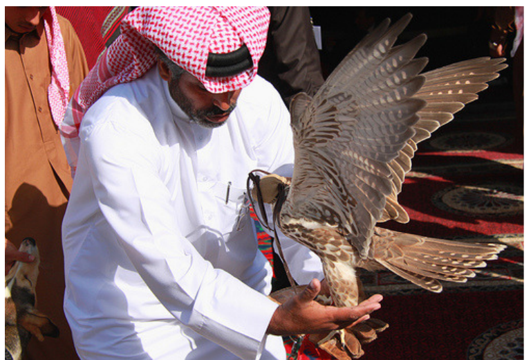
Falkejagt – en gammel tradition i Qatar

Afrejse 6 dage om ugen hele året. Bestil rejsen allerede i dag på telefon 58 56 26 00