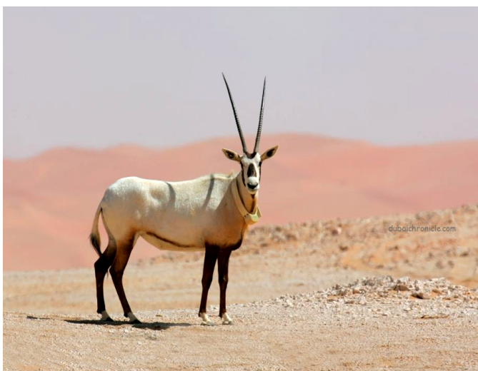
Oryx-antilopen; Qatars Nationaldyr