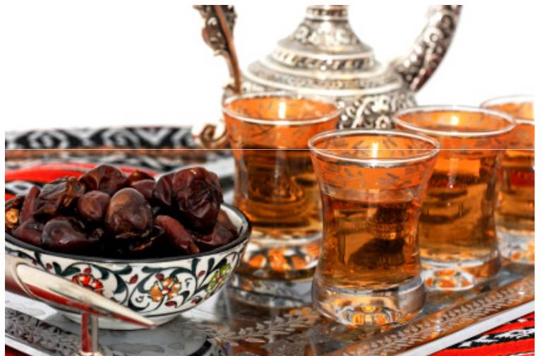
Dadler og té i et beduintelt

Kultur og traditioner har været med til at gøre Qatar til det landet er i dag, en moderne stat med urgamle arabiske traditioner fra dengang beduin-stammer med kamelkaravaner drev gennem ørkenen. Derudover har perlefiskeri, falkejagt, opdræt af arabiske fuldblods-hest, kamelvæddeløb, traditionel arabisk arkitektur og meget mere været med til at skabe et land med en rig kulturel tradition.