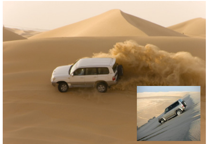
Ørken-safari i jeep i Qatars ørken

Evt. udflugter og transfers er med engelsktalende guide Mulighed for at flytte rundt på evt. udflugter inden afrejse Altid mulighed for forlængelse/forkortelse