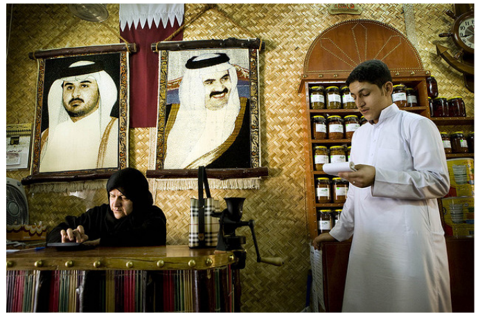
Qatar moderne storby med gamle traditioner