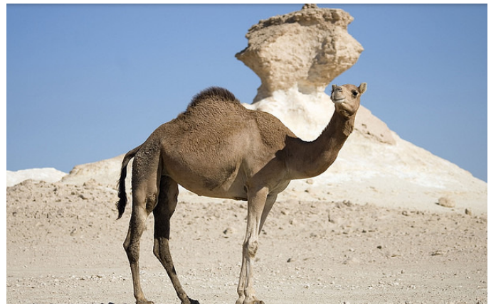
Området ved Zeekret med naturskabte formationer