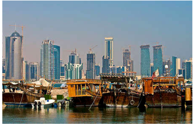
Doha Skyline med traditionelle Dhow-skibe i forgrunden

Turismen er steget flere hundrede procent de sidste 10 år til trods for at det altid har stået lidt i skyggen af Dubai. I hovedstaden Doha, bor 98% af landets 1 million indbyggere. Det er en hurtig voksende hovedstad og overalt dukker nye spændende byggeprojekter op i fantastisk arkitektur især ud til den såkaldte Arabiske Riveira.